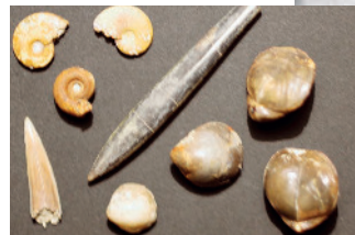
Kleinwüchsig Fossilien: li. Ammoniten und Haiﬂischzahn mi. Belemnit, re. Aulacothyris impressa

Die Fossilien sind kleinwüchsig. Das Namen gebende Leitfossil Aulacothyris impressa , ein Armkiemer, ist an der eingedrückten Schale zu erkennen.