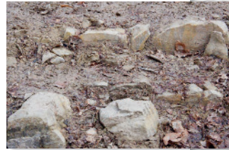
Impressamergel im Übergang zu den Wohlgeschichteten Kalken

Die Grenze zwischen den Mergeln und den Kalken liegt hier wegen der Verwerfung höher als am Fuße des Burgbergs. Unten (liegend) herrschen graue Mergel vor, die von einzelnen Kalkbänken unterbrochen werden. Darüber (hangend) sind gebankte Kalke in der Überzahl. Die Mergelzwischenlagen werden nach oben dünner.